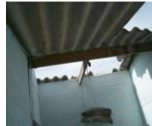
Alchipichi casa parrocchiale

Alchipichi è una comunità vicina a Puellaro che dal 1970 si è popolata per il clima che favorisce l'agricoltura e l'avicoltura e tutt'ora la sua popolazione sta aumentando. Il lavoro pastorale diventa sempre più importante. Il progetto prevede la costruzione di una aula 30 mq circa e il rifacimento del tetto della casa parrocchiale scoperchiato da un uragano tre anni fa.